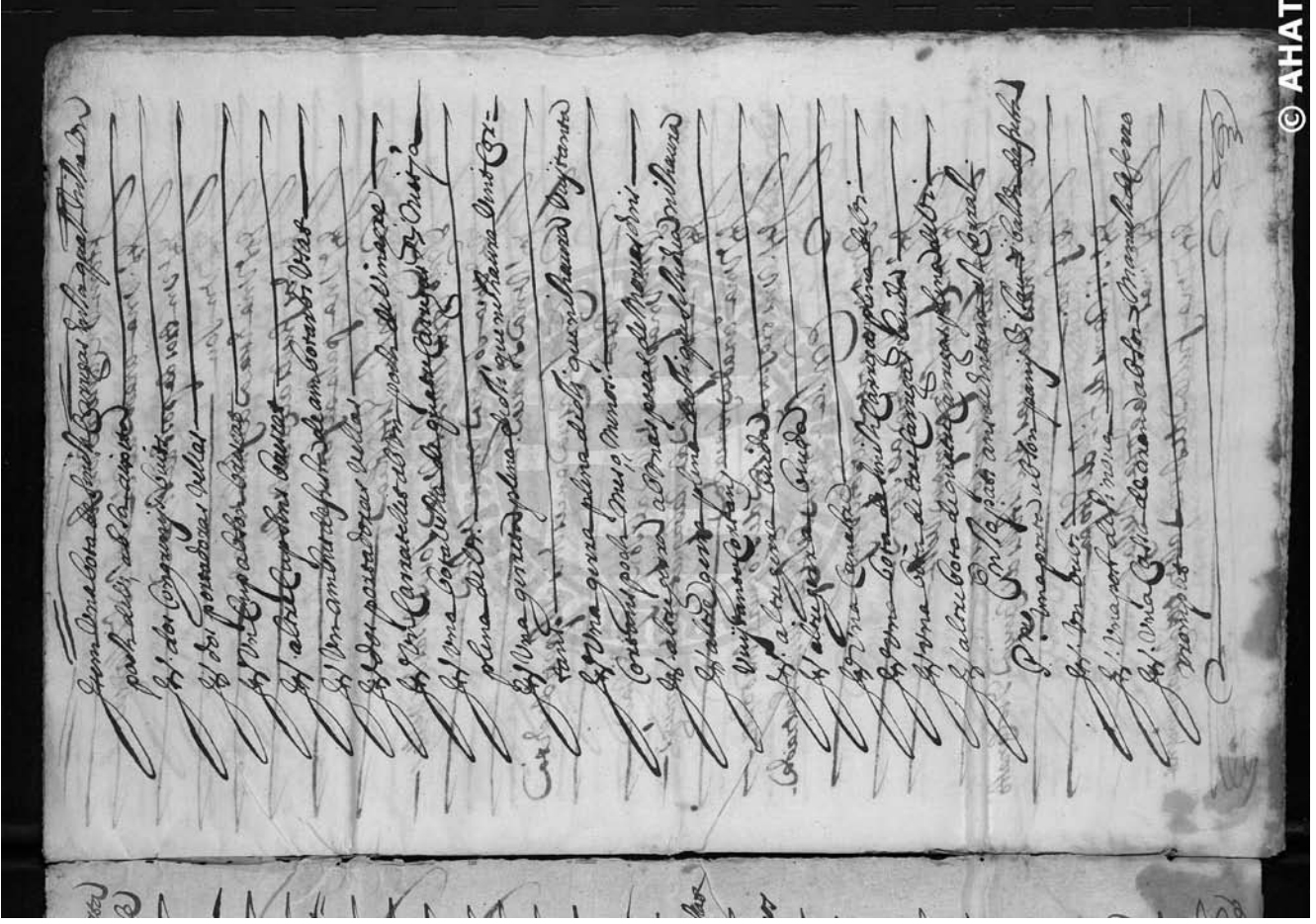
Imatge del fragment de l'inventari post mortem dels bens de Maria Martí de la Pobla (1688)