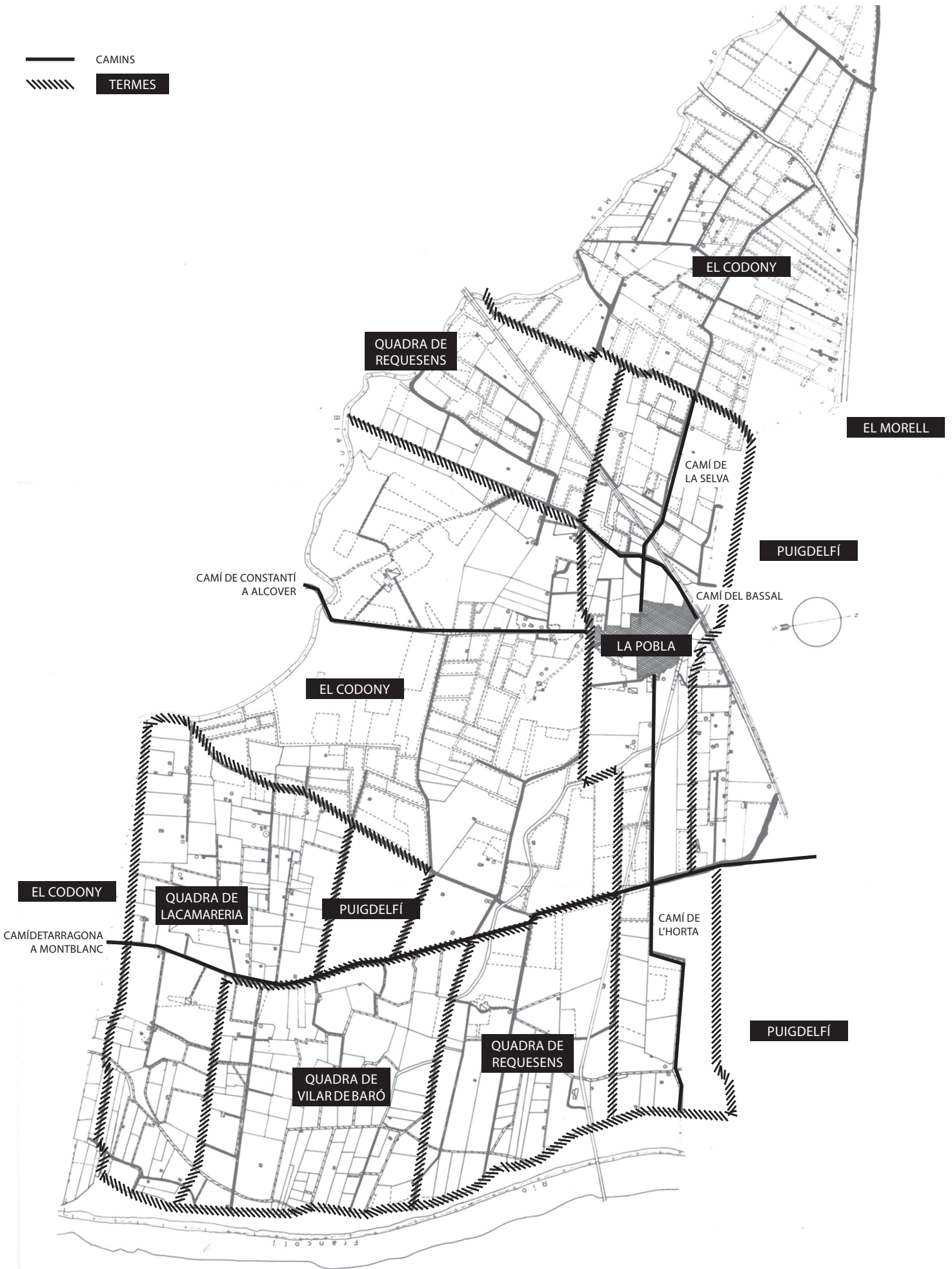
“Situació dels antics termes de La Pobla de Mafumet segons el capbreu de 1510”

AUTOR: Hèctor Mir i Llorente DATACIÓ: 2008