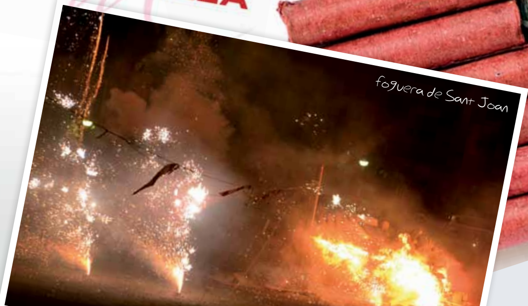
foguera de Sant Joan